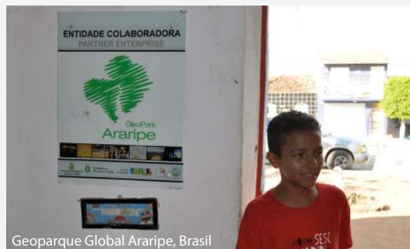
Geoparque Global Araripe, Brasil