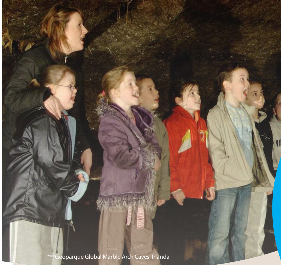
*** Geoparque Global Marble Arch Caves, Irlanda