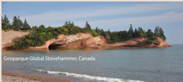
Geoparque Global Stonehammer, Canada

Um Geoparque é um território homogêneo com património geológico de relevância internacional. Os Geoparques usam esse património para promover a sensibilização de questões fundamentais que a sociedade enfrenta no contexto do planeta dinâmico em que vivemos. Muitos Geoparques promovem a sensibilização para os riscos geológicos, incluindo vulcões, sismos e tsunamis, e ajudam a preparar estratégias de mitigação de desastres para as comunidades locais. Os Geoparques guardam registos das alterações climáticas do passado e apresentam exemplos das mudanças climáticas atuais, bem como da adoção das melhores práticas de utilização das energias renováveis e dos melhores padrões de "turismo verde." Os Geoparques também informam sobre a necessidade e o uso sustentável dos recursos naturais, sejam eles explorados em profundidade, a céu aberto ou aproveitados do ambiente e, ao mesmo tempo, promovem o respeito pelo ambiente e a integridade da paisagem. A designação de Geoparque não tem uma definição de lei, porém os principais sítios patrimoniais devem estar protegidos por legislação local, regional ou nacional.