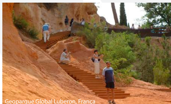
Geoparque Global Luberon, França