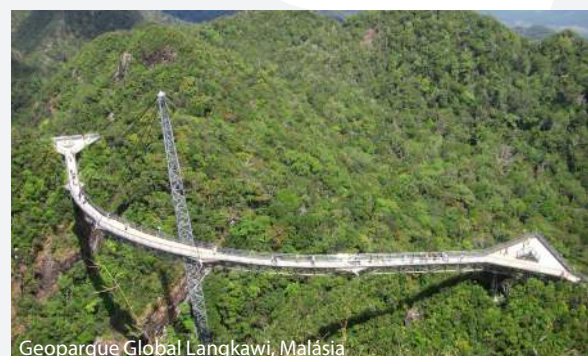
Geoparque Global Langkawi, Malásia

Fundo: Geoparque Global North-West Highlands, Reino Unido.