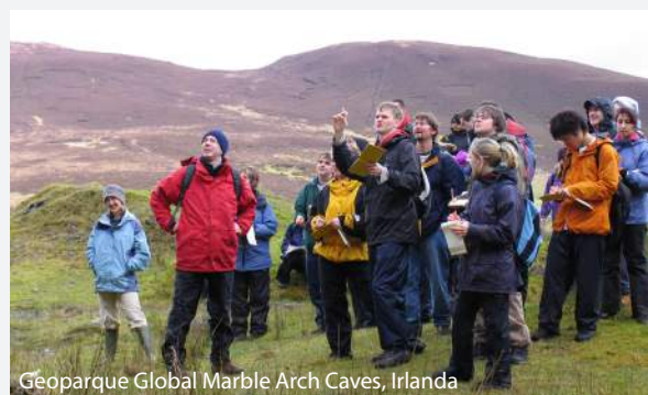
Geoparque Global Marble Arch Caves, Irlanda