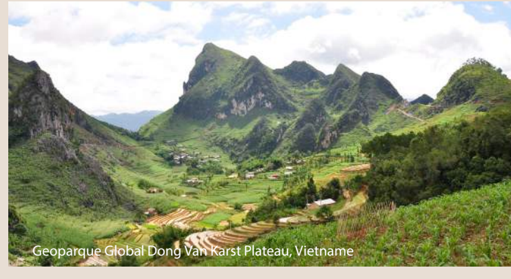
Geoparque Global Dong Van Karst Plateau, Vietnam