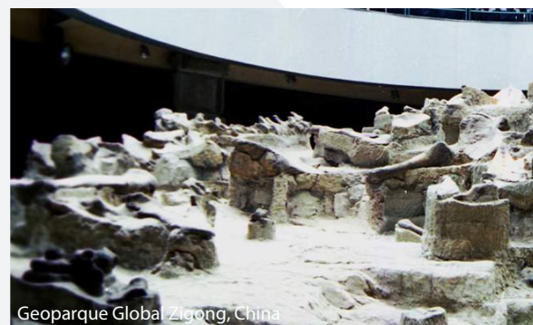
Geoparque Global Luotian, China